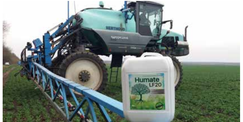
ТОВ «Гарант Агро 4» (Дніпропетровська обл., с. Троїцьке)

Під час обробки рослин альфамінокислоти, що містяться у «LF 20», збільшують проникність клітинних мембран і тим самим полегшують потрапляння поживних речовин всередину клітини. При цьому активізуються дихання і