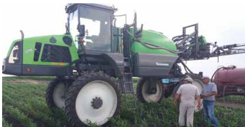
ТОВ «1 Травня» (Кіровоградська обл., с. Піщаний брід)

Україна, м. Київ, вул. Древлянська, 8 +38 044 35 111 36, +38 097 35 111 36